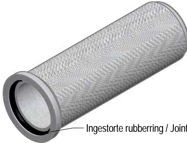
Ingestorte rubberring / Joint incorporé