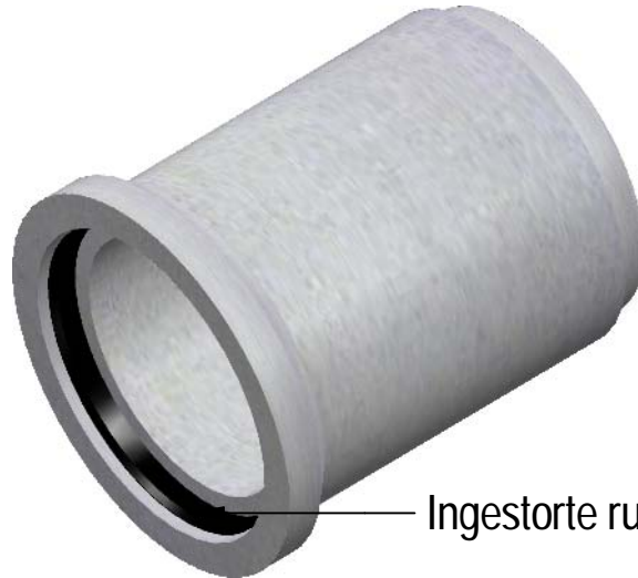
Ingestorte rubberring / Joint incorporé